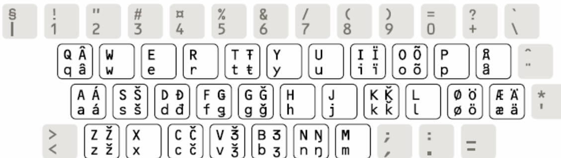
Figure H.4 – Norwegian keyboard with Sami letters: extended-alphabet level layout

Merkit löytyvät näppäimistöltä painettaessa AltGr –näppäintä yhdessä kirjaimen kanssa. Isot kirjaimet AltGr ja Shift ja merkki.