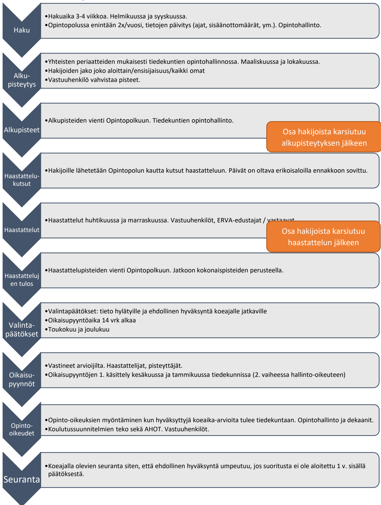
Kaavio 3: Valintamenettelyn kokonaisuus, tehtävät ja toimijat.